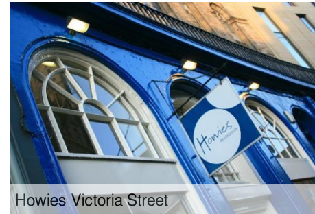
Howies Victoria Street

Vi besøker Scotch Whisky Experience for en reise i whiskyens verden. Vi får se hvordan whisky blir laget og underveis får vi høre