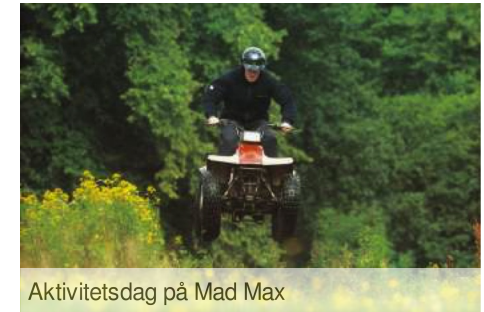
Aktivitetsdag på Mad Max

Etter besøket på Stirling Castle setter vi kursen mot den idylliske landsbyen Crieff for å besøke