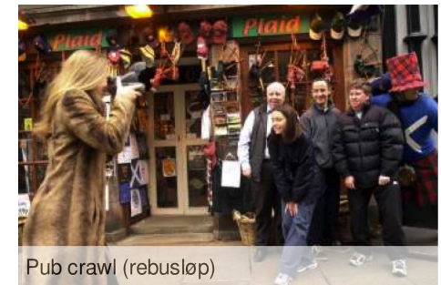
Pub crawl (rebusløp)