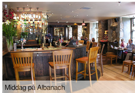
Middag på Albanach