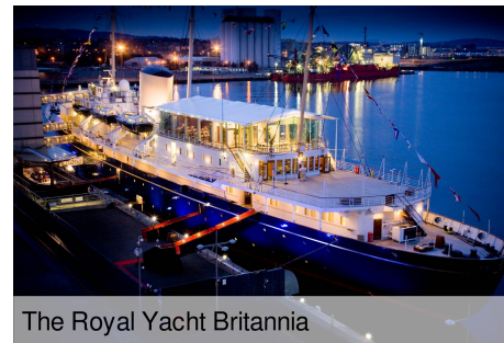
The Royal Yacht Britannia