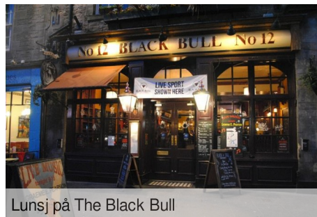
Lunsj på The Black Bull