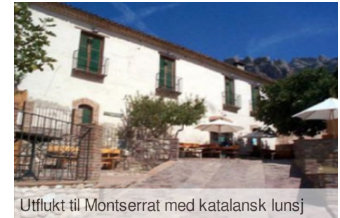
Utflukt til Montserrat med katalansk lunsj