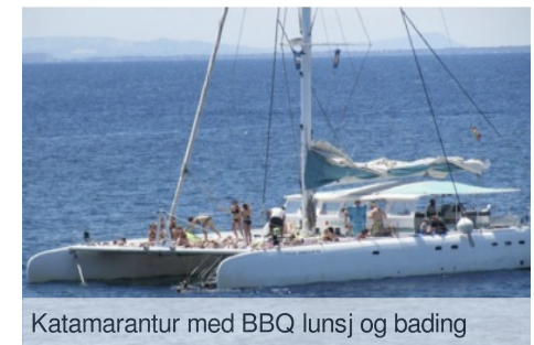
Katamarantur med BBQ lunsj og bading

Etter besøket på vingården reiser vi til en av de finere restaurantene i området og blir servert en 3 retters middag med viner og cava fra gården vi har besøkt.