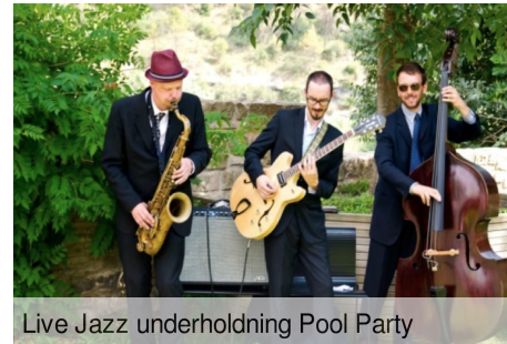
Live Jazz underholdning Pool Party