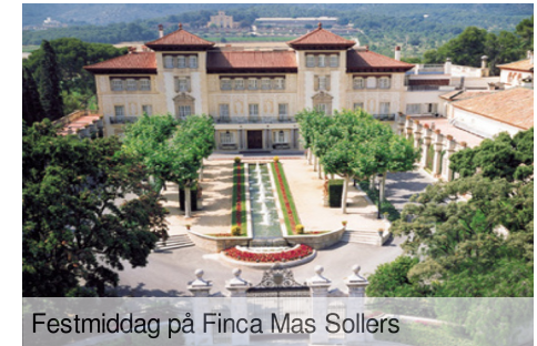
Festmiddag på Finca Mas Sollers