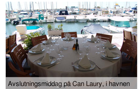
Avslutningsmiddag på Can Laury, i havnen