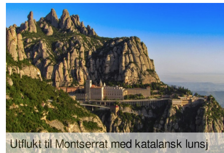
Utflukt til Montserrat med katalansk lunsj