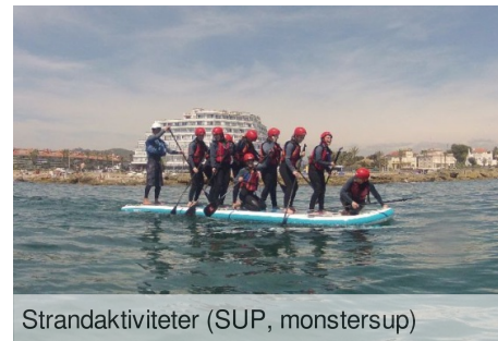
Strandaktiviteter (SUP, monstresup)