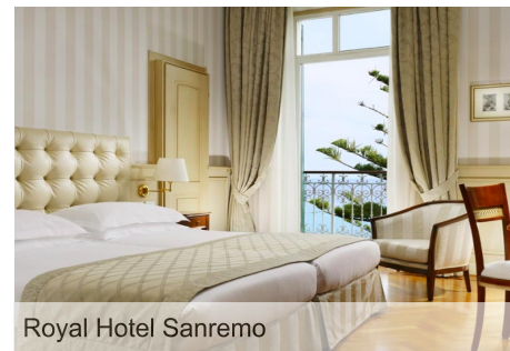
Royal Hotel Sanremo