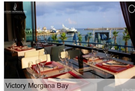
Victory Morgana Bay