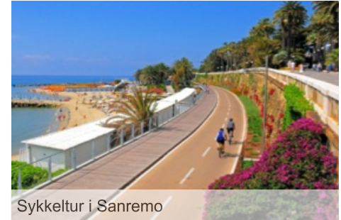
Sykkeltur i Sanremo