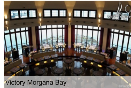
Victory Morgana Bay