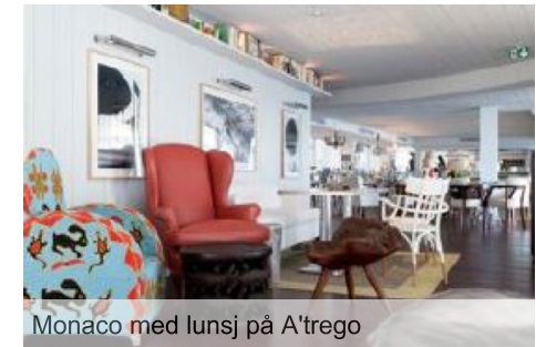
Monaco med lunsj på A'trego